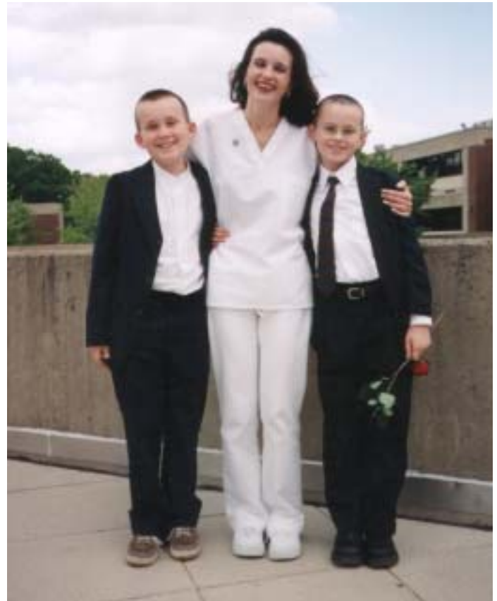
Брат Світовид і син Велес вітають Наталю із закінченням навчання