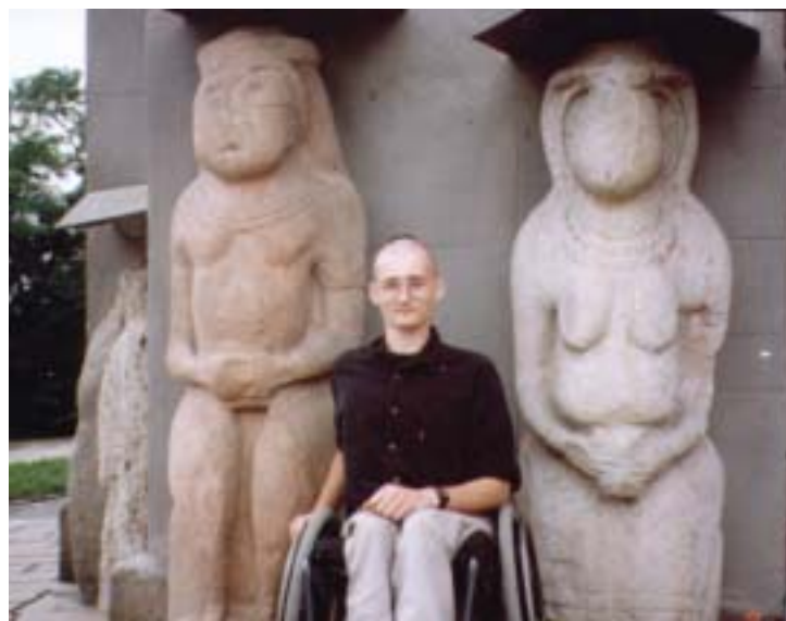
Марко коло київського музею (1997 рік)