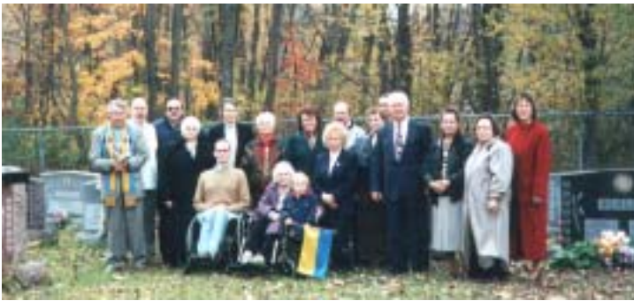
Священна година на Свяопрі, після бурі