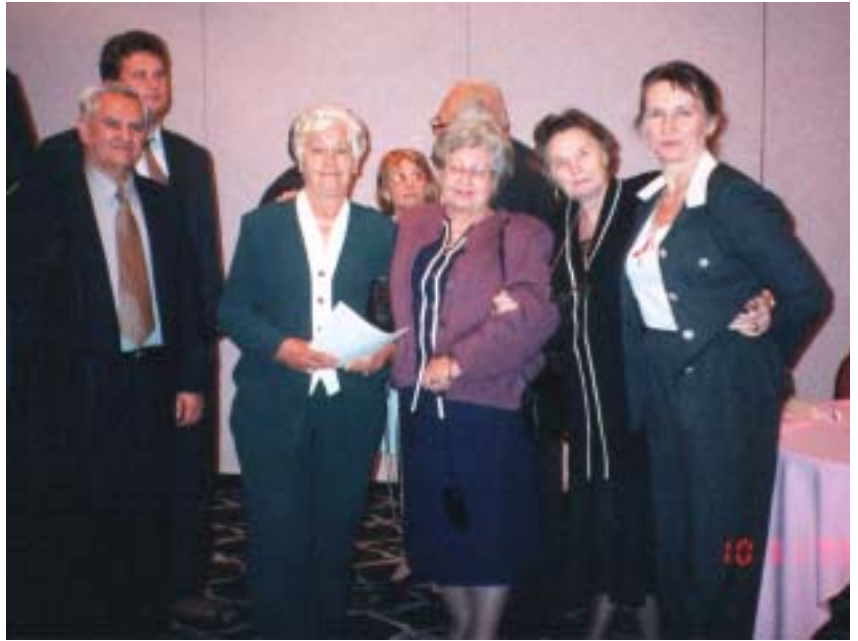
Під час зустрічі з архієпископом Андріаном

Слава Тобі, Дажбоже наш! І вічна пам'ять Героям!