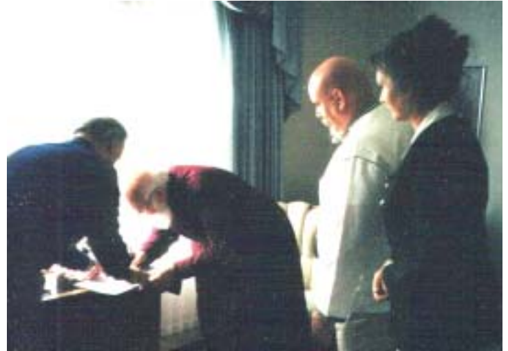
Під час підписання документа

від християнських, богорозумінь українців.