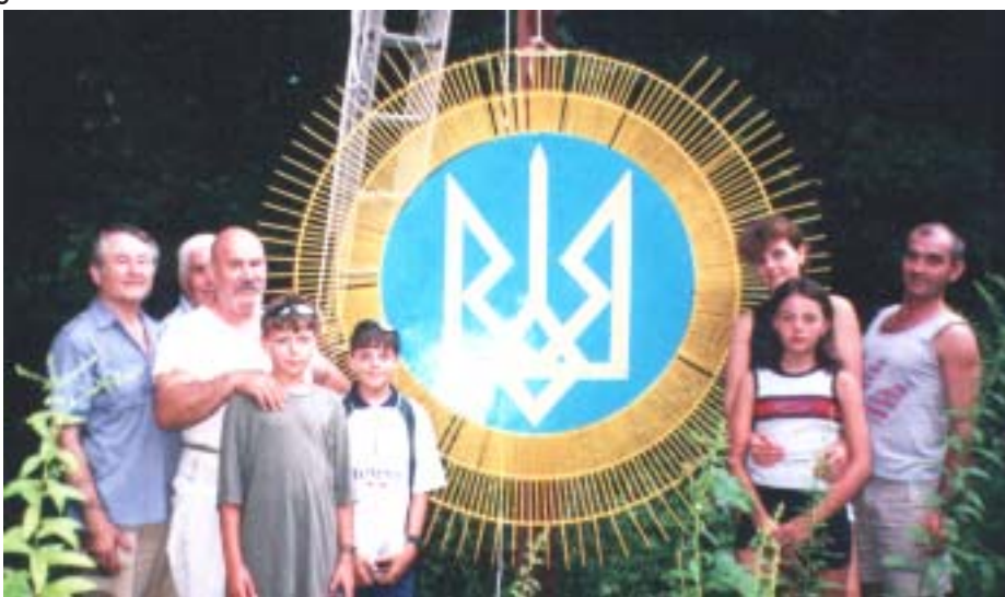
Обновлення РУНВірівського знака коло святині “Оріяна”