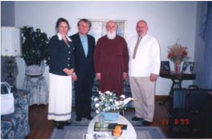
(зліва направо) р-м Л.Драпіко, р-т Б.Свириденко, патріарх Філарет і р-т С.Гуляк під час зустрічі в штаті Конектікут