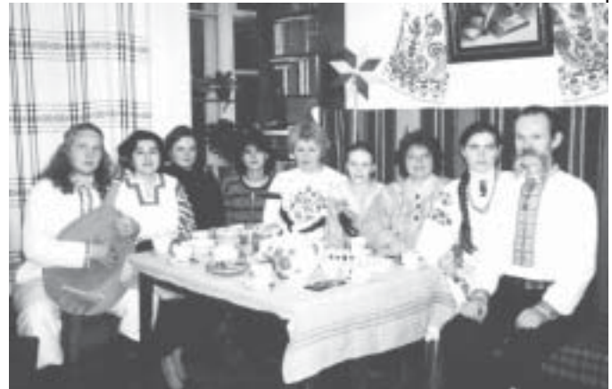
Клуб “Знаки” Громади Б. Островського

Святі наші Предки в часи, названі Трипільською культурою, 5-7 тисяч років тому, а може і значно раніше, взяли за знак пробудження, оновлення Життя – яйце, розписуючи його знаками міжзоряного тяжіння – сарґами, знаками сонця, світла, землі, води, дощу, роси, пророслого зерна, знаками вічності, безмежжя, безсмерття, і назвали таке яйце писанка, а як знак зародження Життя, крові –