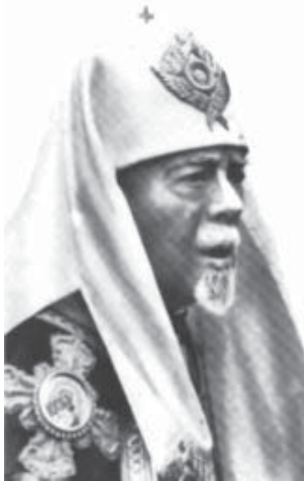
Патріарх Київський і всієї України