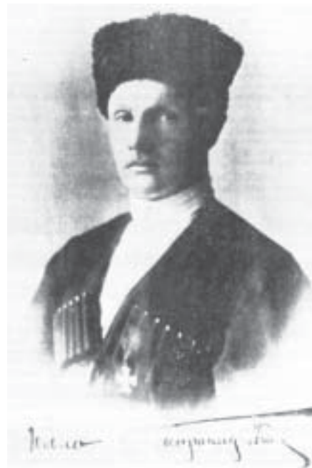
Павло Скоропадський Гетьман всієї України 1917 - 1918

29-го квітня, 1918 року (80 років тому) всі кораблі чорноморського флоту, що стояли в Севастополі, піднесли українські синьо-жовті прапори. Ця радісна подія трапилась в честь перебрання влади в Україні гетьманом П. Скоропадським. Заходами Гетьмана, до України був